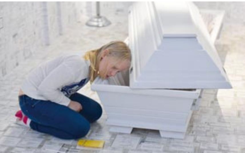
Die interaktive Ausstellung „ Erzähl mir was vom Tod “ wurde hauptsächlich für Kinder konzipiert und ermöglicht interaktive Wissensvermittlung zum Thema Sterben und Tod. Sie ist bis zum 20. Januar 2019 im Berliner FEZ zu sehen.