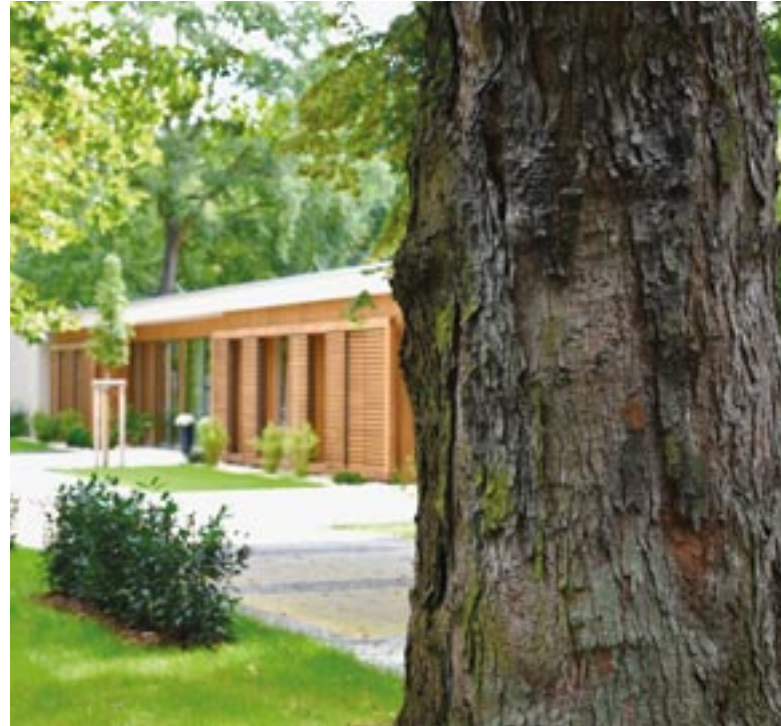
Das Hospiz Köpenick kurz nach der Eröffnung im Mai 2017.

Herumgesprochen hat sich auch: Es müssten noch mehr Hospize gebaut werden. Denn die meisten Menschen hierzulande sterben in Krankenhäusern, die allerdings der Gesundheit von Patienten dienen sollen. Fragt man Männer und Frauen, wovor sie am Lebensende Angst haben, kommt