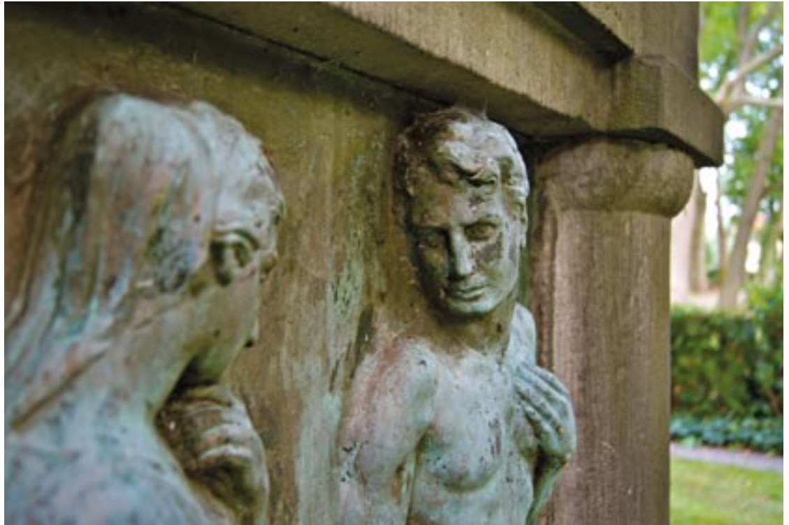
Einige der älteren Grabmale erinnern an neoklassizistische Gebäude oder romantische Gemälde. Die Veränderungen in den Bestattungsformen von einst bis in unsere Zeit sind deutlich sichtbar.

Was wäre, wenn wir dann Gelegenheit hätten, das im Leben Versäumte für einen Augenblick nachholen zu können? Das einst Unausgesprochene auszusprechen, einen letzten Blick zu schenken, einen Händedruck, ein Streicheln, einen liebevollen Gruß. Mit der Kaffeetasse in der Hand schien es mir, als wäre jedes einzelne Grab eine Einladung zum Innehalten. Meiner Mutter hätte das gefallen. Glaube ich zumindest, denn fragen kann ich sie nun nicht mehr. Der Gedanke, die Uhr zurückdrehen zu können, erscheint mir verlockend.